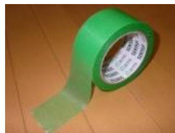
図 3 養生テープ見本

学校側指定により、装飾用テープに関しては「養生テープ」(右図の写真参照)を使用していただきます。それ以外のテープや学校施設の汚染につながる装飾方法は禁止とします。