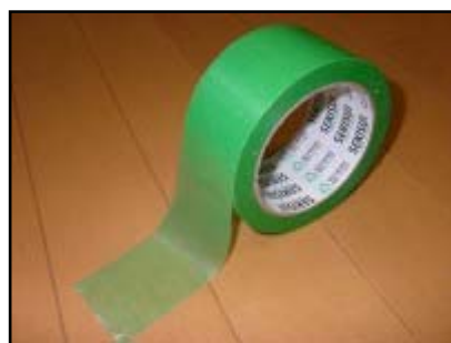
図 2 養生テープ

教室には自由に飾りつけすることができます。終了後は必ず元の状態に戻してください。 模造紙等を壁に貼り付ける際には、跡が残らないように「養生テープ」を使用してください。 ガムテープやセロテープなどの使用は禁止されています(教室の使用については『3-3 教室について』を参照)。